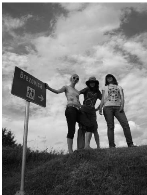
Volonteri u Zaboku