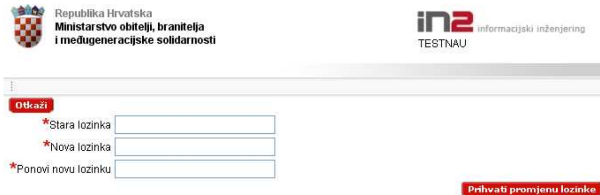
Slika 14. Promjena lozinke

Lozinku u svakom trenutku možete promijeniti odabirom poveznice „Promjena lozinke“ koja se nalazi u glavnom izborniku. Otvara se novi prozor kao na slici 14.